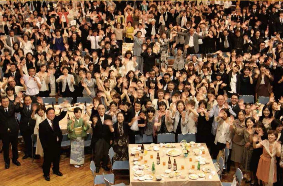
2014年6月6日 松涛会職員による祝賀会