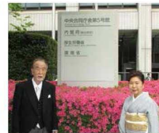
厚生労働省にて伝達式