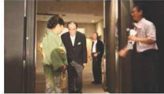
終わりました。ありがとうございました。