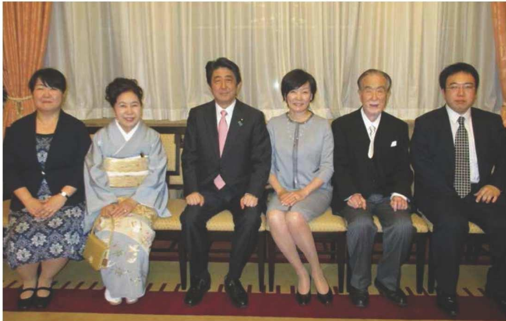
5月16日、安倍総理ご夫妻よりお祝いのお言葉をいただきました。(於：首相官邸)