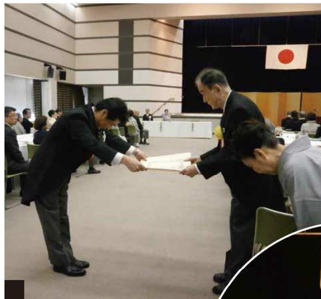
田村厚生労働大臣より勲章伝達