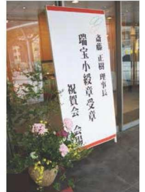
松清会職員(485人)による祝賀会