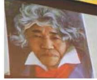
長崎師長によるビデオレター