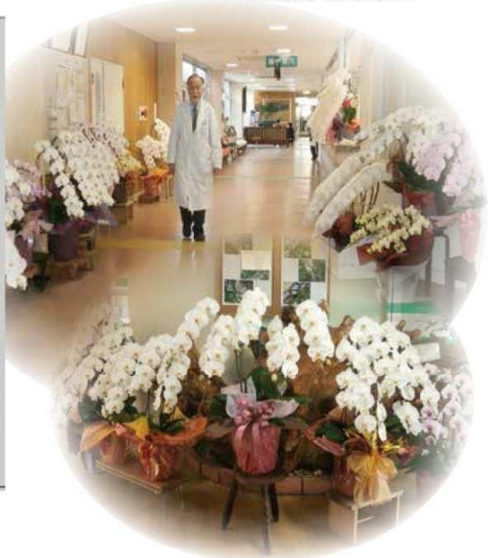
読売新聞 4月29日掲載

2014年春の叙勲受勲者が決まり、山口県からは75人（うち女性9人）が選ばれた。地方自治、社会福祉、保健衛生、農業振興、中小企業振興、消防など、さまざまな分野で尽力してきた受勲者の喜びの声を聞いた。（1面に関係記事）